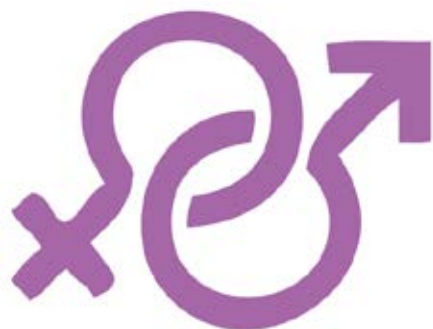
tavolo di lavoro sulle politiche di genere

È ancora possibile aderire al Tavolo, sia a titolo individuale sia in forma associata, secondo le modalità indicate sul sito del Comune. Informazioni, disciplina di funzionamento e modulo di adesione sono infatti disponibili su www.comune.bagnacavallo.ra.it .