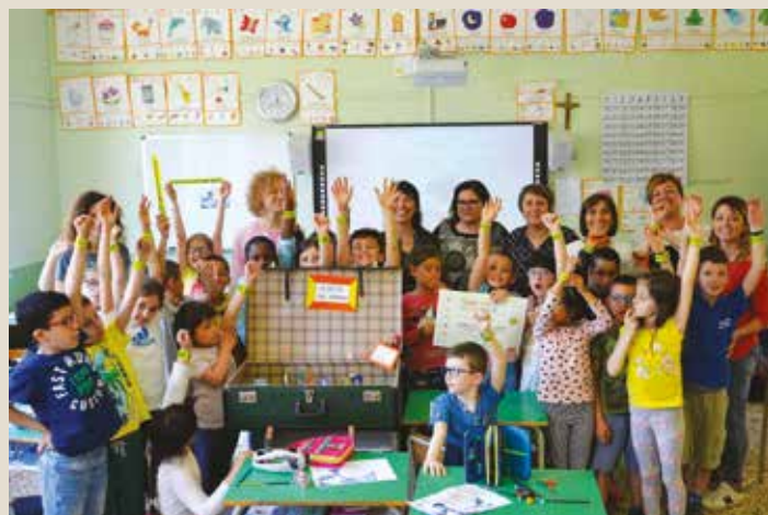
Classe 2 a C

S i sono svolte a maggio le premiazioni di Siamo nati per camminare, campagna regionale per la mobilità sostenibile sui percorsi casa-scuola, e La Bassa Romagna Prende Piede . I due progetti sono stati sviluppati sul nostro territorio grazie al lavoro sinergico tra il Ceas Bassa Romagna, il Servizio Edu-