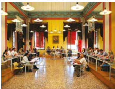
Il Consiglio comunale durante la prima seduta.