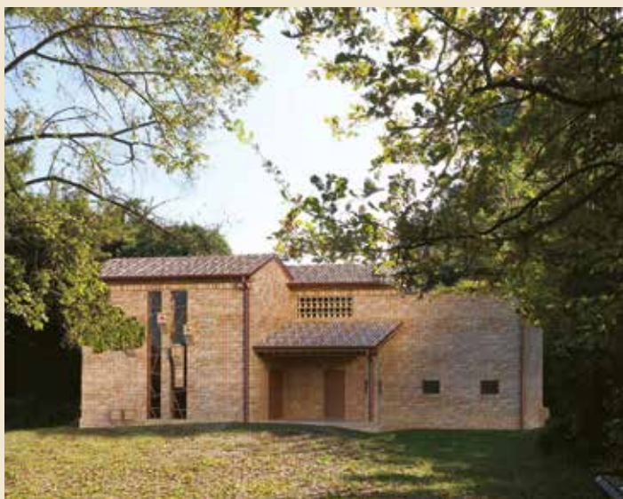
Il rendering della casa del Podere.

S ono iniziati i lavori per la riqualificazione della vecchia casa colonica annessa al Podere Pantaleone. Il progetto ha l'obiettivo di valorizzare e rendere fruibili gli spazi della casa – un tempo di proprietà della famiglia Pirazzoli, soprannominata "Pavlèna", poi acquistata dal Comune di Bagnacavallo nel 1988 assieme ai terreni del podere stesso – per le attività