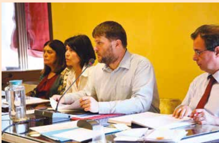
Al centro, il presidente Matteo Giacomoni durante l'apertura del Consiglio.

Matteo Giacomoni , consigliere del Pd, è stato eletto presidente . Quarantaquattro anni, Giacomoni è stato consigliere comunale dal 2004 al 2009, assessore dal 2009 al 2019, vicesindaco dal 2011 al 2019.