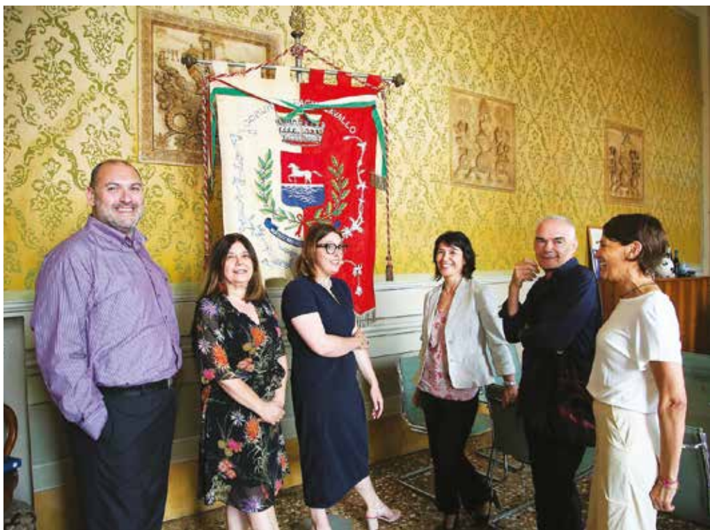
La nuova Giunta comunale.

rappresentano appieno la nostra idea di città: infrastrutture, economia, cultura, ambiente, solidarietà e partecipazione. Non abbiamo mai smesso di lavorare per le due opere fondamentali per Bagnacavallo e non soltanto: il sottopasso di via Bagnoli e il nuovo svincolo dell'autostrada sulla via Albergone. E ci sono poi importanti interventi progettati e finanziati e che sono in corso di realizzazione o partiranno a breve: la casa del Podere Pantaleone, l'ampliamento del centro culturale Le Cappuccine, i lavori su Palazzo Abbondanza e Palazzetto, il recupero