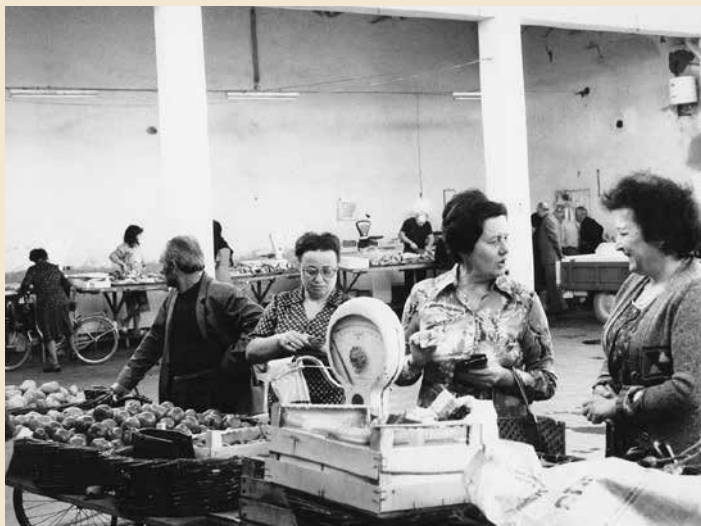
Il Mercato Coperto negli anni Settanta.