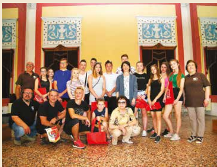
I giovani pallavolisti di Strzyzow ospiti a giugno a Bagnacavallo.

Le opere prevedono la ripavimentazione dell'area centrale e dei vani accessori laterali, la realizzazione di servizi igienici, nuovi impianti elettrici e meccanici, la verifica e il rinnovo delle vetrate, il ripristino dei calcestruzzi e degli intonaci interni ed esterni, il ripristino delle guaine del tetto e la sistemazione dei