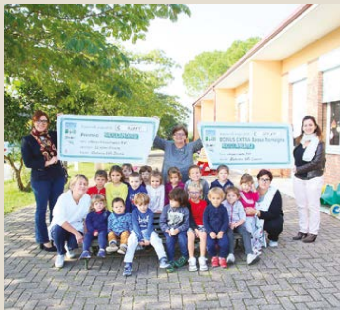
La scuola dell'infanzia Villa Savoia di Glorie.

Tra le scuole del comune di Bagnacavallo il miglior