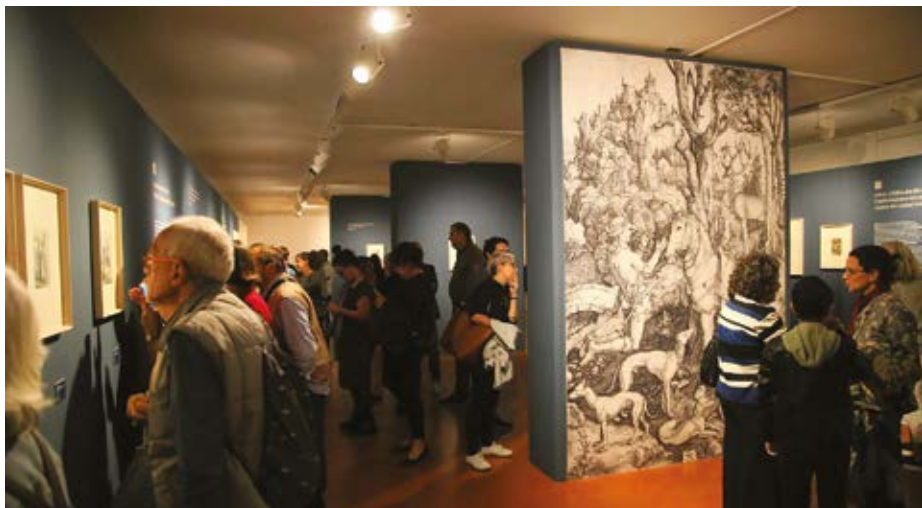
La mostra di incisioni del Dürer.

legamento con la grande mostra Albrecht Dürer. Il privilegio dell'inquietudine organizzata dal nostro Comune, curata anch'essa da Diego Galizzi, assieme a Patrizia Foglia, e ospitata sempre presso il Museo delle Cappuccine fino al 19 gennaio 2020. L'evento espositivo propone più di 120 opere grafiche del maestro di Norimberga provenienti da prestigiose collezioni pubbliche e private italiane. Il taglio che i curatori hanno voluto dare all'allestimento offre molto più che una rassegna di opere d'arte, ma un vero e proprio racconto, che procede attraverso dieci sezioni tematiche, immergendo il visitatore nel visionario sogno di perfezione di un ragazzo, figlio di un umile orafo di Norimberga, che ha voluto inseguire il suo desiderio di appropriarsi dei segreti della rappresentazione della bellezza ●