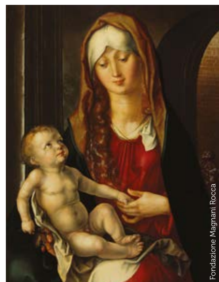
Fondazione Magnani Rocca

Il ritorno del dipinto è in stretto col-