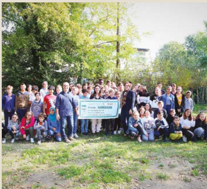
La scuola secondaria di Villanova.

G iunto alla sua ottava edizione, il concorso Riciclandino , che promuove l'utilizzo delle stazioni ecologiche da parte di studenti e famiglie, continua ad essere molto apprezzato dai cittadini della Bassa Romagna.